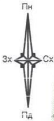
СХЕМА ЗАБУДОВИ ЗЕМЕЛЬНОЇ ДІЛЯНКИ Будівництво садового будинку на земельній ділянці №310 в садово-городньому товаристві "Червона Калина" у м. Львові